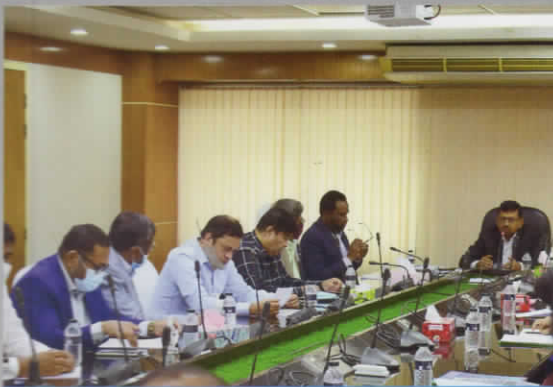
MEETING WITH CUSTOMS BOND COMMISSIONER, DHAKA